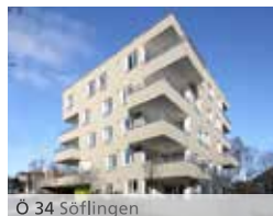
Ö 34 Söflingen