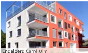
Engelberg Carré Ulm